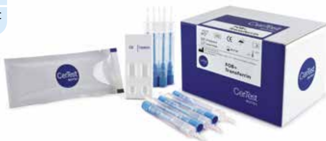
Certest FOB-Transferrin Combo Card, 20 tester, FT882001F